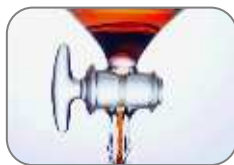
viscosas de baja densidad